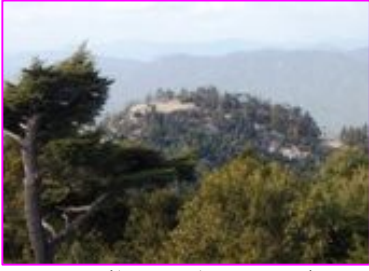
弥山から大勢の登山者が見える駒ヶ林