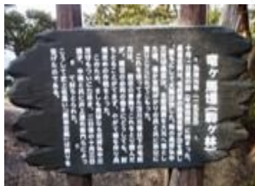
駒ヶ林(厳島合戦の古戦場)