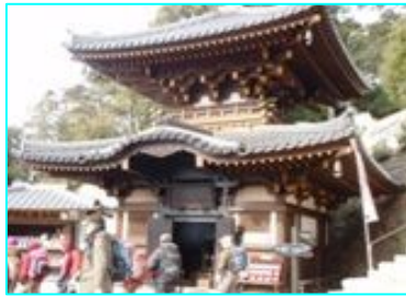
1200年燃え続ける霊火堂