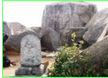
頂上岩(神の盤座石)